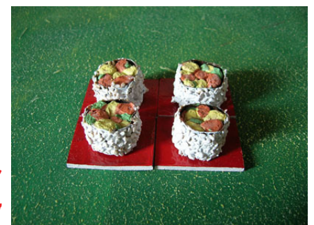
Uramaki - Wb alga intorno al ripieno