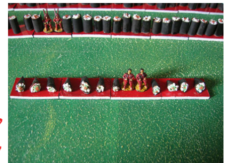
Temaki - Bw forma di cono