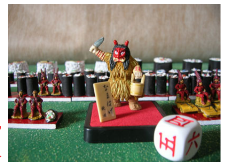
Namahage - Campo babbanatale