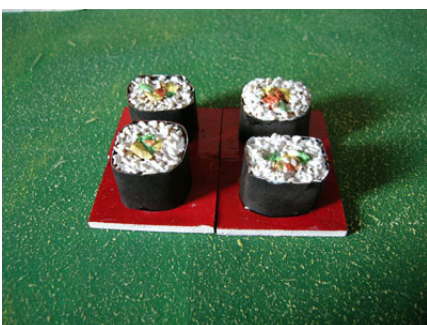
Futomaki - Hd grandi dimensioni