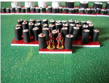
Tekkamaki - Bd ripieno tonno