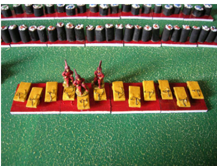
Geta - Cv sandalo tradizionale