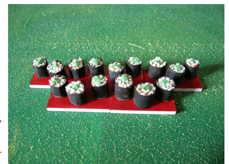
Kappamaki - Ax ripieno zucchine